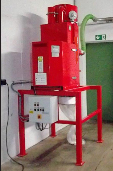
TowerVac 76 MultiPac in einer Milchpulveranlage

Die MultiPac-Geräte sind in verschiedenen Ausführungen lieferbar - fahrbar oder stationär.